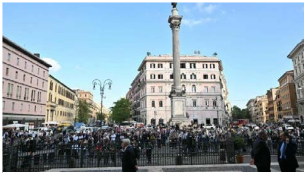
Các tín hữu hiệp thông cầu nguyện cho Đức Giáo Hoàng Phanxicô tại quảng trường phía trước Vương Cung Thánh Đường Đức Bà Cả, ngày 21.04.2026.

Hình ảnh bông hồng trắng đặt bên cạnh tên “Franciscus” trên mộ phần của Đức Giáo Hoàng Phanxicô tại Vương Cung Thánh Đường Đức Bà Cả trở thành dấu chỉ của điều không tàn úa, của sự sống không bao giờ kết thúc. Đó là lời nhắc về sự sống đời đời như một ánh sáng dịu nhẹ nhưng bền bỉ, về sự tinh tuyền và nhất là tình yêu của một người cha đã trao ban trọn vẹn cho thế giới. Chính điều này cũng được Đức Thánh Cha Lêô XIV gọi lại trên chuyến bay từ Angola đến Guinea Xích Đạo, chặng dừng chân cuối cùng của hành trình Tông Du Châu Phi của Ngài.