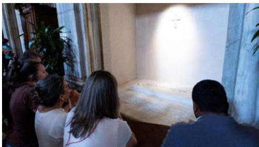
Các tín hữu viếng mộ phần của Đức Giáo hoàng Phanxicô, ngày 21.04.2026.