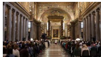
DHY Giovanni Battista Re chủ sự Thánh Lễ giỗ đầu Đức Giáo hoàng Phanxicô tại Vương Cung Thánh Đường Đức Bà Cả, Roma, ngày 21.04.2026.