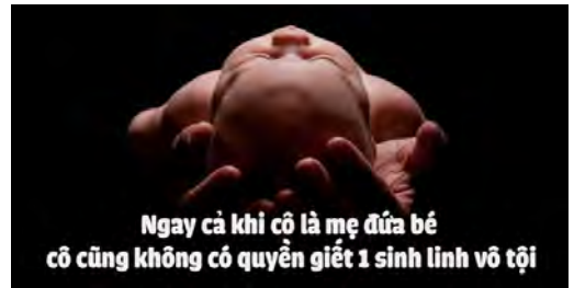
Ngay cả khi cô là mẹ đứa bé cô cũng không có quyền giết 1 sinh linh vô tội

Người ta bảo rằng giả như trước khi phá thai, cha mẹ của bào thai được tiếp cận với người chuyên môn đủ tâm và đủ tầm, thì bào thai có nhiều cơ hội chào đời. Thay vì hoang mang, bối rối đến bất chấp mọi thứ để phá thai, họ bình tĩnh để nhìn nhận vấn đề. Ước gì họ có