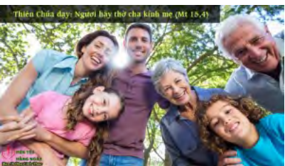
Thiên Chúa dạy: Người hãy thờ cha kính mẹ (Mt 15,4)