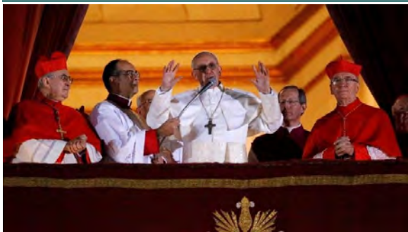
Thứ Năm, ngày 13/3/2025, đánh dấu 12 năm Giáo Hoàng của Đức Thánh Cha Phanxicô, Giáo Triều Roma, Giáo Phận Roma, cùng nhiều cá nhân và tổ chức đã gửi lời chúc mừng đến Đức Thánh Cha, cầu chúc Ngài mau bình phục.

Trong một bản tin, Ban Giám Đốc Viện Bảo Tàng và Di Sản Văn Hoá của Vatican, cùng tất cả các cộng tác viên bày tỏ vui mừng kỷ niệm 12 năm ngày Đức Thánh Cha Phanxicô được bầu chọn vào thềm tác vụ Phêrô. Lời chúc mừng được mở đầu bằng một đoạn trong lời chào đầu tiên của Đức Thánh Cha vào ngày 13/3/2013: “Chúng ta hãy luôn cầu nguyện cho chính chúng ta: cầu nguyện cho nhau. Chúng ta hãy cầu nguyện cho tất cả thế giới để thế giới có được một tình huynh đệ lớn lao”. Nhân dịp đặc biệt này, mọi người chúc mừng Đức Thánh Cha, chúc Ngài sớm bình phục. Toàn thể nhân viên của Viện Bảo Tàng Vatican cũng bày tỏ sự quý mến, gần gũi và cầu nguyện cho Đức Thánh Cha.