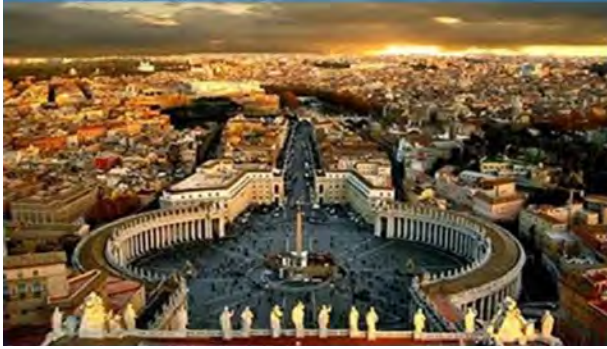
Lm. Timothy Radcliffe, O.P.