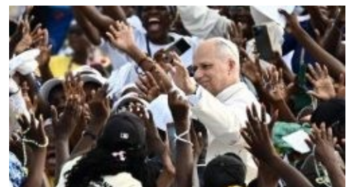
Ngày 19/04/2026, ngày thứ 2 tại Angola