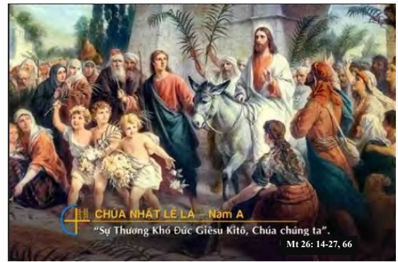
CHÚA NHẬT LỄ LA - Năm A "Sự Thương Khó Đức Giêsu Kitô, Chúa chúng ta". Mt 26: 14-27, 66