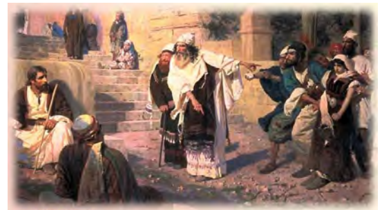
Họ hỏi Chúa Giêsu: "Thưa Thầy, thiếu phụ này bị bắt quả tang phạm tội ngoại tình, mà theo luật Môsê, hạng phụ nữ này phải bị ném đá. Còn Thầy, Thầy dạy sao?" Họ nói thế có ý gài bẫy Người để có thể tố cáo Người.

ta khỏi chết. Thánh Phaolô quả quyết với chúng ta như thế trong Bài đọc II. Một khi đã hiểu biết và đã gặp gỡ Chúa Giêsu trong đời mình, vị Tông Đồ của chúng ta sẵn sàng chấp nhận mất hết mọi sự, miễn là có được Đức Kitô và được kết hợp với Người. Khi sám hối trong Mùa Chay, chúng ta được nghe Chúa nói: tôi cũng không lên án anh (hay chị, hay ông bà) đâu, hãy về đi và từ nay đừng phạm tội nữa. Với lời Chúa, chúng ta được trở nên con người mới, bước sang một ngã rẽ mới để làm lại cuộc đời. Chúa đã quên tội lỗi của chúng ta. Dù ta tội lỗi đến đâu, Người vẫn ở bên ta, để nâng đỡ và phù trợ với tình yêu thương của Người. Xin cho chúng ta cảm nhận được sự hiện diện kỳ diệu ấy. Amen.